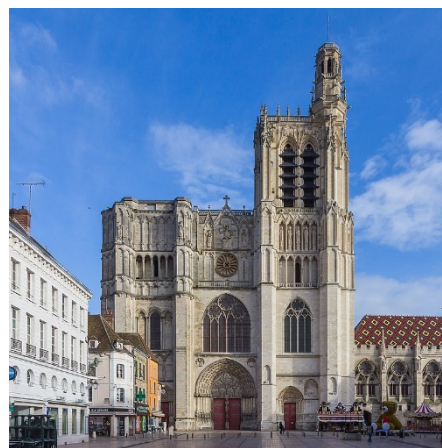
Sens: den første gotiske katedral

Dette er dagen for afrejse tilbage til Danmark. På vejen til Charles-de-Gaulle-lufthavnen kan vi besøge to steder. Først byen Sens vest for Troyes, ved Yonne-floden. Her var ærkebispesædet der havde Paris under sig, og her byggedes den første egentlige gotiske katedral (efter bl.a. forarbejderne i Saint-Denis-klosterkirken), Cathédrale Saint-Étienne (dvs. for sankt Stefanus). Byggeriet af koret påbegyndtes allerede 1130, før Notre-Dame i Paris, og med tydeligt romanske træk. Dette er altså et af gotikkens fødesteder. Men som ved så mange middelalderlige bygning er der blevet bygget til senere; det flotte tværskib i flamboyant stil er således fra ca. 1500.