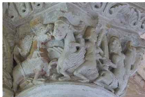
Notre-Dame de Cunault: Udsmykket kapitæl

Denne dag begiver vi os fra Angers og krydser Loire-floden ind i grevskabet Poitou, der var en del af hertugdømmet Aquitanien, der går helt ned til Pyrenæerne - med mål i Poitiers. På vejen gør vi først hold i den store klosterkirke Notre-Dame de Cunault , der kombinerer stilarter fra 1000-tallet til 1200-tallet; kirken var et populært Maria-valfartssted og indrettet til at modtage store skare af besøgende med et hævet kor så alle kunne se og høre; de 223 kapitæler fra 1100-tallet kan ses hvis man medbringer en kikkert.