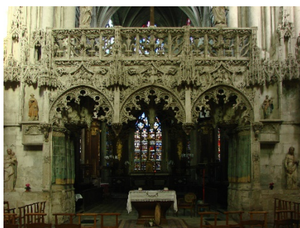
Lektorium i Madelaine-kirken

Troyes gloriøse middelalder fremgår også af kirken Basilique Saint Urban . Denne kirke (ellers dens autentiske middelalderlige dele) blev bygget på ca. 25 år i den gotiske stil der dominerede fra midten af 1200-tallet, den 'rayonnante' ('udstrålende', som i de store rosevinduer) og hvis ideal var at udskifte så meget af væggen med glas som muligt. Kirken blev bygget i midten af 1200-tallet af pave Urban 4., som var søn af en skomager fra Troyes, og den blev bygget på den lod hvor hans fars værksted havde stået.