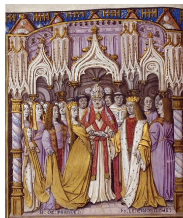
Brylluppet imellem Henrik 5. og den franske prinsesse Katherine, 1420

Kirken Sainte-Madeleine skal være den ældste (endnu eksisterende?) kirke i Troyes. Maria Magdalena var en af middel-