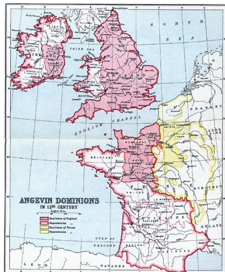
Da det vestlige Frankrig var under den engelske konge: 1100-tallet, anden halvdel, det 'angevinske imperium' (eller 'plantagenet-imperiet')