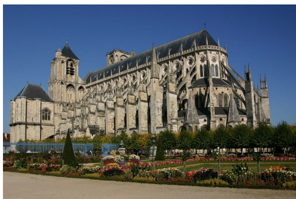
Katedralen i Bourges

Bourges' strategiske betydning fremgår af dens storslåede katedral, Saint-Étienne , bygget 1195-1260, altså i samme periode som de store katedraler i og omkring Paris, og som et udtryk for et rigt sam-