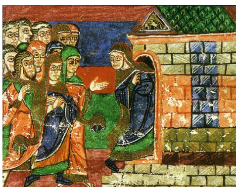
Radegunde modtager medsøstre i sit nye kloster

Poitiers har imidlertid også en righoldig religionshistorie. Byen blev tidligt kristen allerede i 300-tallet under biskop Hilarius (Saint Hilaire) der var mentor for Sankt Martin (dansk: Morten) af Tours, den vestlige kristendoms vigtigste helgen. Fra ca. denne tid – hvor senantikken er ved at forvandle sig til tidlig middelalder – findes bevaret de ældste dele af et dåbskapel, Le baptistère Saint-Jean (Sankt Johannes). Den er den allerældste bevarede kristne bygning i Vesteuropa.