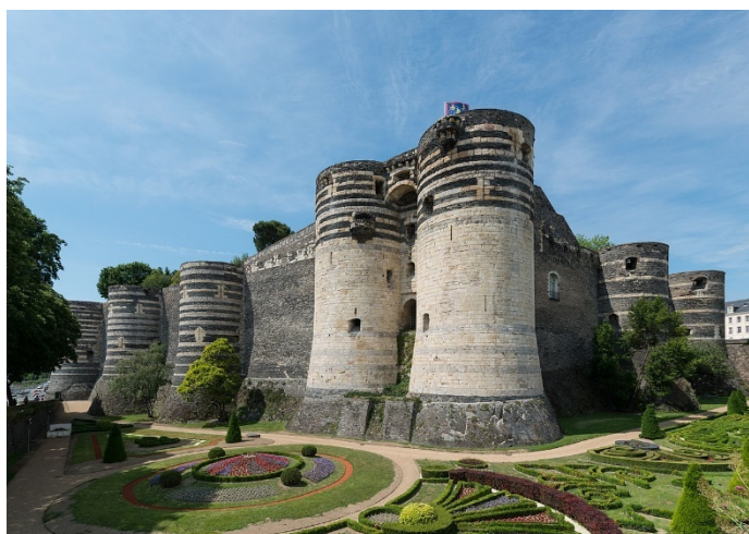
Slottet i Angers, 1200-tallet

Den moderne by Angers er blevet udnævnt til den bedste by at bo og leve i i Frankrig. Med sin strategiske beliggenhed i det rige Loire-område var den også i højmiddelalderen en vigtig by. Beliggende ved Loirefloden, mellem Tours mod øst og Nantes længere ude mod vest, var den i 1100-tallet behersket af engelske fyrster. I princippet var Anjou et grevskab, og dermed et len, under den franske krone; men dets greve, Henrik 2., var også hertug af Normandiet og konge af England og desuden hertug af Aquitanien, i kraft af sit ægteskab med hertuginde Eleonora. Fra Anjou udgik den engelske kongeslægt Plantagenet, der regerede til og med den berygtede kong Richard 3.