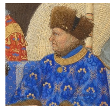
Jean de Berry

I Bourges har vi atter to overnatninger. Byen ligger i området Berry, der fra ca. 1100 tilhørte det egentlige kongelige domæne. I 1300-tallet blev det til et hertugdømme for den berømte Jean de Berry, broder til kong Charles 5 – lige kendt for sin evne til at udsuge sine undersåtter og for sin storstilede mæcen-virksomhed; han bestilte flere pragtfuldt illustrerede 'tidebøger' (håndskrifter med tidebønner), hvis billeder er en udtømmelig kilde til senmiddelalderens liv blandt adel og bønder og til mange pragtbygninger. I 1451, altså i hundredeårskrigen anden omgang, beherskede den engelske kong Henrik 5., i alliance med burgunderne, hele det nordlige Frankrig, ned til Loirefloden. Den franske tronfølger, Charles 7., blev hånet som 'kongen af Bourges' (altså før Jeanne d'Arc ændrede Frankrigs skæbne).