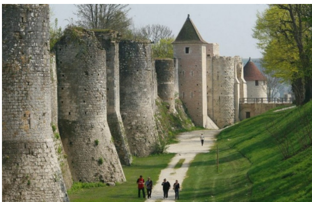
Provins: befæstet by

Det andet stop på vejen til Paris gøres i byen Provins , en anden af de middelalderlige markedsbyer i Champagne. Hele den øvre by er Unesco-verdensarv. Her kan man få et godt indtryk af en middelalderbys befæstning. Ud over kirken Saint-Quiriace, hvis kor er fra 1100-tallet, og det samtidige fæstnings-