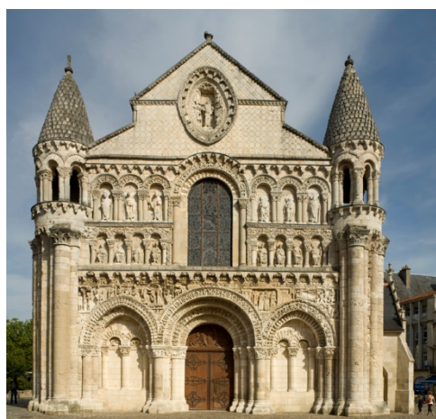
Notre-Dame la Grande-la-Grande

Poitiers har yderligere interessante kirker fra middelalderen. Tæt ved Radegunde-kirken ligger den store katedral Saint-Pierre , påbegyndt i anden halvdel af 1100-tallet, der er et fint eksempel på den angevinske gotik, der på nogle punkter minder mere om den samtidige engelske end om den nordfranske gotik. I midten af byen ligger en arkitektonisk og religionshistorisk perle, kirken