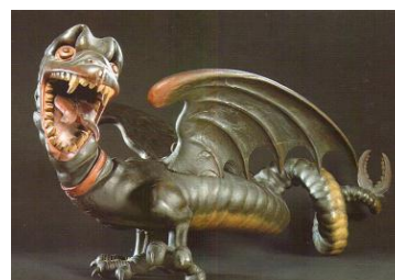
Grand'Goule, dragen i Poitiers

I 500-tallet, under de frankiske konger (merovingerne), grundlægger dronning Radegunde (Radegonde) et kvindekloster her som hun selv flytter ind i (bl.a. for at slippe bort fra hoffet og sin mand, kong Klotar (Clotaire) 1, og dermed fra pligterne som dronning og hustru). Den berømte Radegunde bliver hurtigt kåret til helgen, og hendes kloster, viet til det hellige kors, bliver et vigtigt pilgrimsmaal. Klosteret selv er ikke bevaret; men hendes grav kan stadig ses i en kirke, Église Sainte-Radegonde , hvis ældste dele er fra 1000-tallet. Radegunde bliver også en af byen Poitiers skytshelgener, inkl. at hun (som så